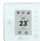
Zonenregler Think AZCE6THINKRB