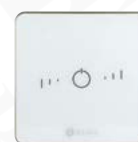
Zonenregler Lite AZCE6LITERB/CB