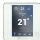
Zonenregler Bluezero AZCE6BLUEZEROCB