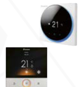
Fernbedienungen BRC1KPD51W/K, BRC1H52W7/K7/S7