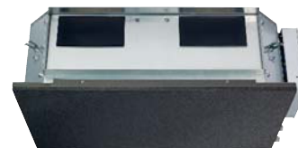
Modell ARXC 60GATH

Die Fujitsu Zwischendeckenmodelle ARXC mit einer statischen Pressung von 100 – 300 Pa werden vor allem dort eingesetzt, wo höchste Leistungsfähigkeit in punkto Luftmenge und Kühlleistung gefordert ist. Aufgrund der hohen statischen Pressung können auch sehr lange Luftleitungen angeschlossen werden.