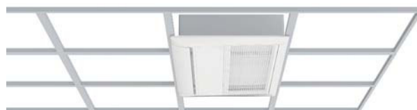
Integration in genormte Euro-Rasterdecke