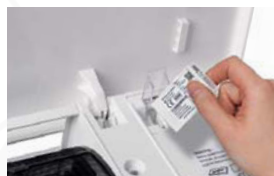
Kinderleichte WLAN-Anbindung per WiFi-Modul

Das optionale WiFi-Modul mit USB-Steckverbindung ist sekundenschnell und unsichtbar in der Inneneinheit platziert. So einfach wie das Einstecken eines USB-Sticks in den PC. Kein separates Montieren, kein zusätzliches Verkabeln, einfach in den USB-Port der Inneneinheit einstecken – fertig.