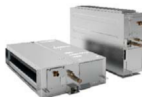
ARXG: Bei Hochkantmontage ggfs. Belüftung oder Sicherheits- einrichtung erforderlich

unterkante sind somit ohne zusätzlichen Montageaufwand für externe Pumpen möglich.