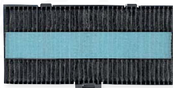
VICO-Filter in Kombination mit Langzeitfilter