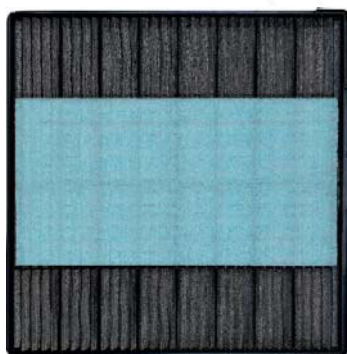
Standardfilter, ergänzt mit VICO-Filter