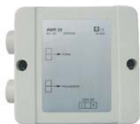
Aktive Winterregelung AWR 39K