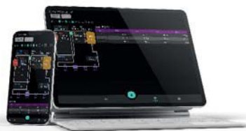
Service-Monitor (Software) UTY-ASSX