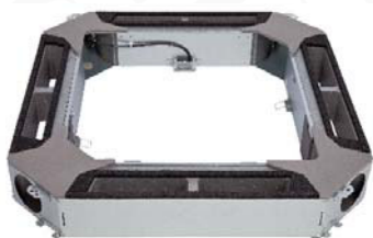
Frischlucht-Kit für Kassetten-/3D-Kassettenmodelle UTZ-VXRA