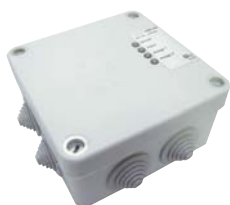
Redundanzmodul USM 208