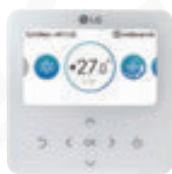
Standard III PREMTB101