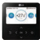
Standard III PREMTBB11