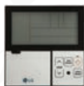
Standard II PREMTBB01