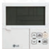
Standard II PREMTB001