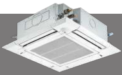
PLFY-MS20 - 125VEM2-E