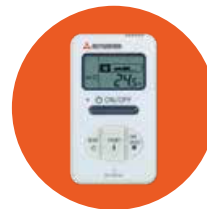
Einfache Kabel-FB RCH-E3*, 5)