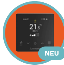
Touch-FB RC-ES1 mit App Funktion