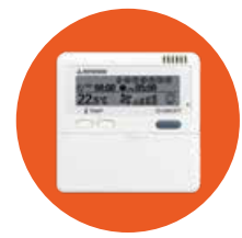
Kabel-FB RC-E5*, 5)