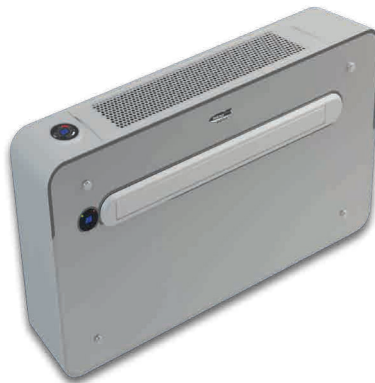
iDREAM Monoblocco a pavimento Double duct