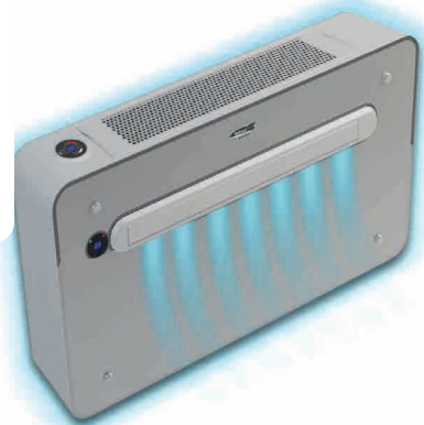
iPURE Monoblocco a pavimento sanificante Double duct with filtering system