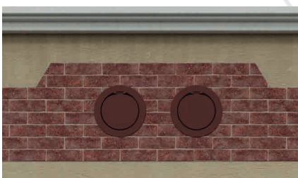
Griglie a scomparsa tilting grilles